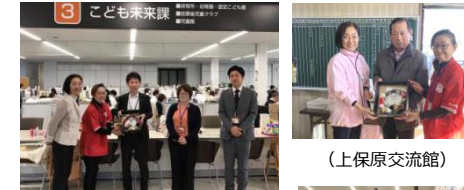
(伊達市 こども未来課)