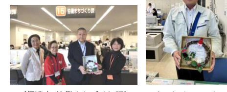
(伊達市 協働まちづくり課)