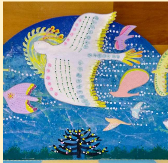
壁面オブジェタイトル：「海も山もこえて飛ぶ」2023年9月製作