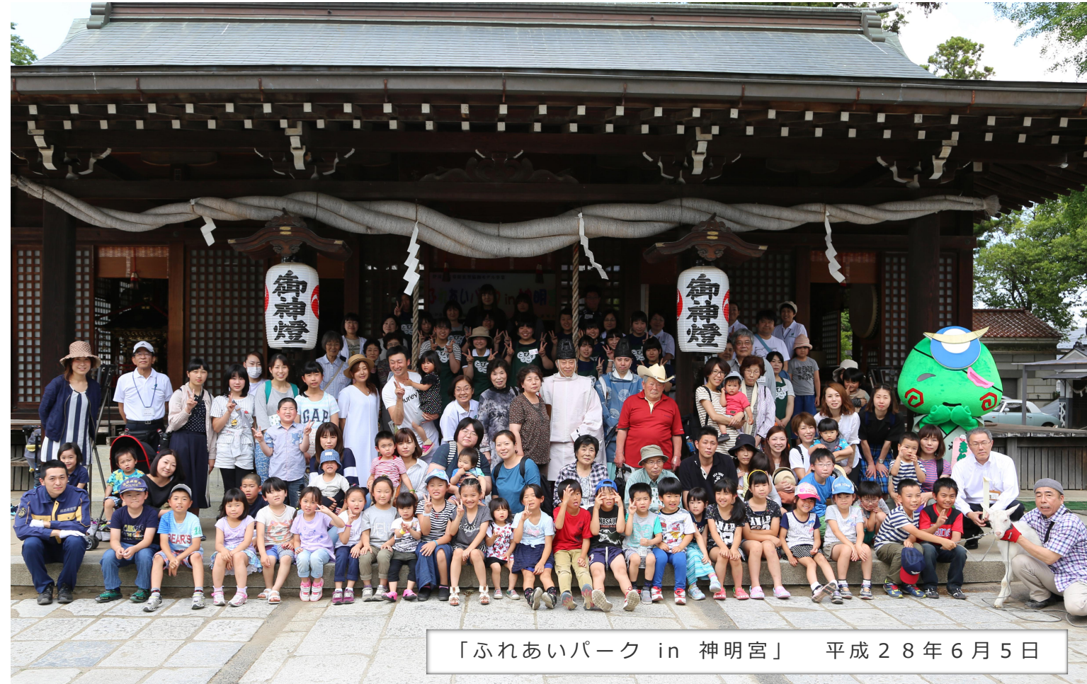
「ふれあいパーク in 神明宮」 平成28年6月5日